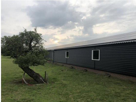
De 110-jarige Anatov-appelboom