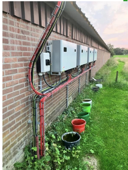
Omvormers worden buiten gemonteerd